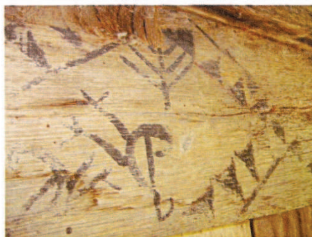
Lámina 2.-Detalle de uno de los liños donde podemos ver un ave y un arbolillo.