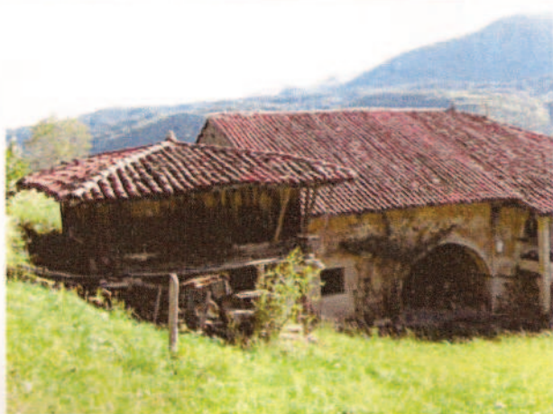
Lámina 1.- Vista de la fachada principal del hórreo que se sitúa al sur.